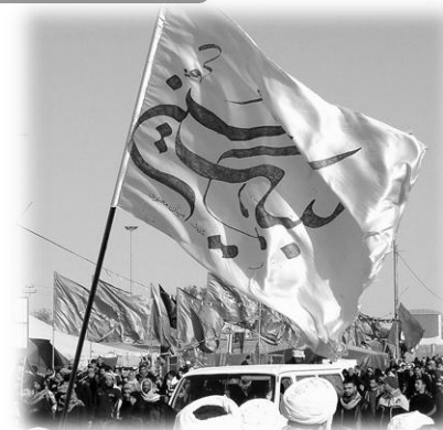
*پیامهایی که فقط در پیاده‌روی اربعین می‌توان به جهانیان منتقل کرد

پیاده روی میلیونی اربعین که در چند سال اخیر شاهد آن هستیم، یکی از تحول‌های عمیق در بین شیعیان است که می‌تواند علامت قریب الوقوع بودن ظهور حضرت باشد. این تحولی که امروز شما در میان شیعیان می‌بینید شبیه همان تحولی است که قبل از انقلاب در ایران اسلامی پدید آمده بود که حضرت امام(ره) درباره آن فرمودند: «این تحول روحی، این تحولی که در جوانهای ما پیدا شد، این دست خدا بود؛ بشر نمی‌تواند در ارواح مردم این طور مؤثر باشد. آن خداست که مقلب القلوب است، قلبها دست اوست، متحول می‌کند... ان شاء الله که این چهره‌های نورانی ذخیره برای اسلام باشد و متصل بشود این زمان به زمان ظهور مهدی - سلام الله علیه» (صحیفه امام/ ۳۱/۹) همه ما می‌دانیم، برای اینکه یک چنین راهپیمایی باشکوهی به سمت کربلا صورت گیرد، کار تبلیغاتی و تربیتی چندان صورت نگرفته است، پس چگونه ممکن است دل‌های مؤمنین علی‌رغم شرایط موجود و علی‌رغم همه تبلیغاتی که وجود دارد این طور متحول شوند؟ چنین حرکت عظیمی را کسی نمی‌تواند با تبلیغات، شکل داده باشد.