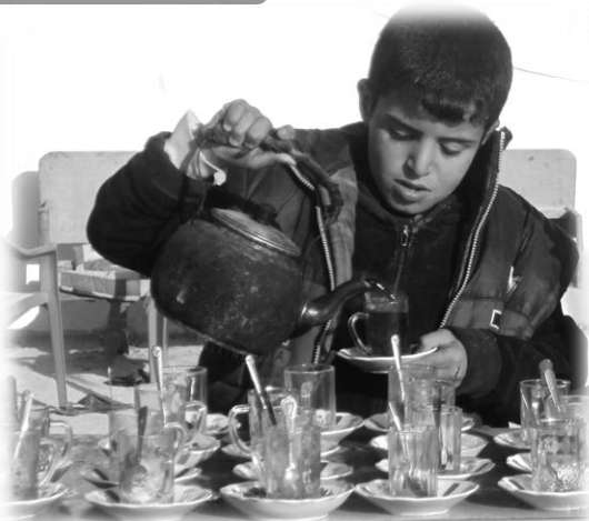
عدم شیوع بیماری‌هایی مانند سرماخوردگی در میان جمعیت عظیم ۱۷ میلیونی زائرین اربعین، نکته قابل تأملی است

کسانی که به حج مشرف شده‌اند حتماً تجربه مریض شدن در این سفر را دارند. این درحالی است که در حج خانه خدا، فقط سه و نیم میلیون زائر حضور پیدا می‌کنند و علی‌رغم رعایت نکات بهداشتی و استفاده از مواد استریل کننده و ... باز هم اکثر حج‌ج به نوعی بیماری و یا سرماخوردگی مبتلا می‌شوند. اما نکته بسیار جالب در مورد مراسم اربعین حسنی در کربلا این است که در طول مسیر