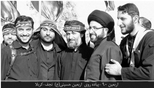
اربعین ۹۰ - پیاده روی اربعین حسینی(ع) - نجف-کربلا

ایشان در مدت یکسال اقامت خود در نجف اشرف (۱۳۶۹-۱۳۷۰ق) دو مرتبه توفیق پیاده روی از نجف تا کربلا را داشته‌اند که با "پای برهنه" از مسیر شط (رودخانه) که حدود ۲۰ کیلومتر طولانی‌تر از مسیر کنونی نجف کربلا بوده است و حدود ۳ روز به طول می‌انجامیده است، به زیارت اباعبدالله الحسین(ع) رفته‌اند